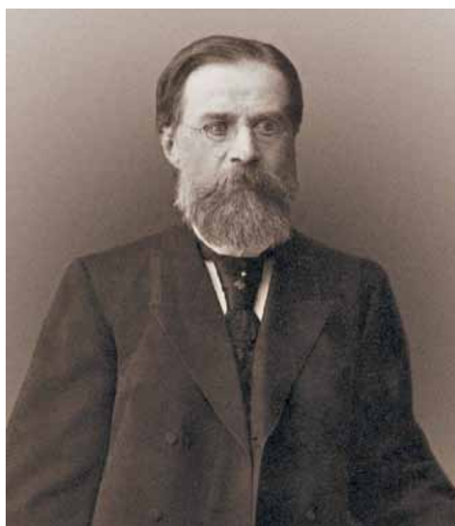
Александр Григорьевич Столетов (1839–1896)

В своем опыте Столетов использовал наполненный газом стеклянный баллон с двумя электродами. Позже этот элемент стал называться газонаполненным фотоэлементом. Баллоны фотоэлементов после откачки воздуха наполняли разреженным газом – неон или аргоном (как впрочем и сегодня). Присутствие газов в фотоэлементе повышает его чувствительность. Когда на катод фотоэлемента падают световые лучи, через прибор идет ток. В первые десятилетия своего существования фотоэлемент был только физическим прибором. Он